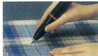
繊維製品のカットに