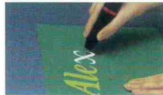
フィルムのカットに