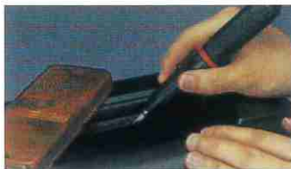
プラスチック製品のカットに