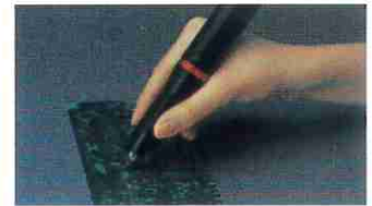
基板のパターンカットに